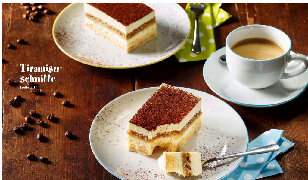
Dolci | Süßes